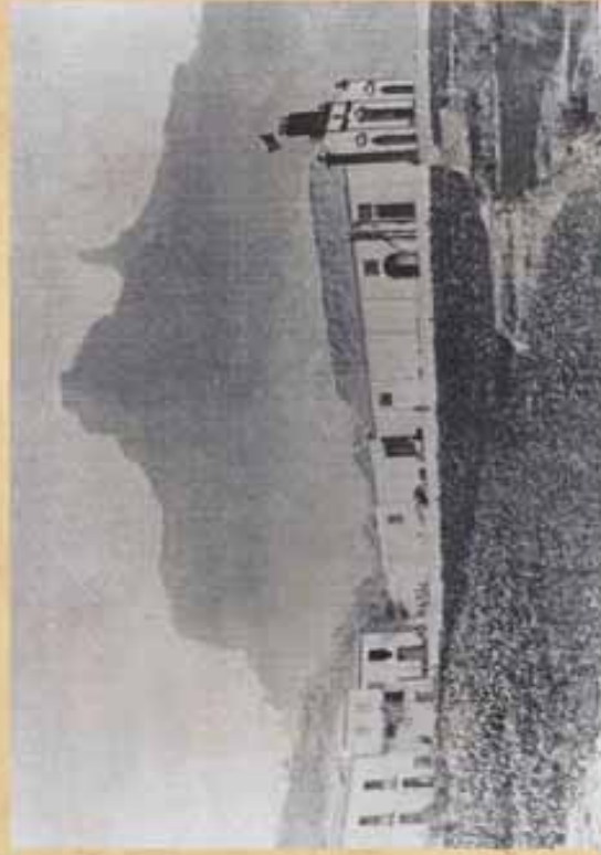
Imagen de la Iglesia Ntra. Sra. del Socorro destruida por el incendio en 1920. Tejeda, circa 1919

Fueron pasto de las llamas, más de 15 imágenes, 6 cuadros, 14 Vía Crucis, vestimentas, joyas, retablos, mobiliario, un órgano recién comprado que, según consta en la documentación consultada, era "de los mejores de Gran Canaria". Dicho instrumento fue donado por los emigrantes tejedenses, "indianos" afincados en la isla de Cuba y que fue comprado con dinero procedente de una suscripción pública. Un inventario datado en 1902, da cuenta del patrimonio eclesiástico existente en aquel momento, y que actualmente está desaparecido.